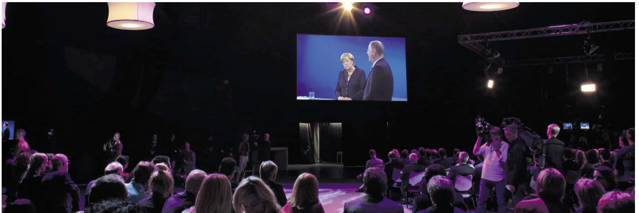
PARTILEDERDEBAT. Europas største og folkerigeste land går til valg 22. september. Den konservative kansler, Angela Merkel, fører klart i meningsmålingerne. SPD og Peer Steinbrücks bedste chance er at blive en del af koalitionen.